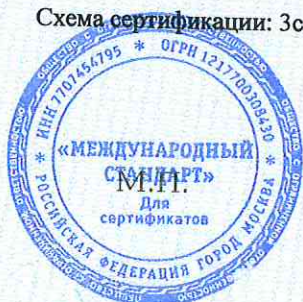
Схема сертификации: 3с.